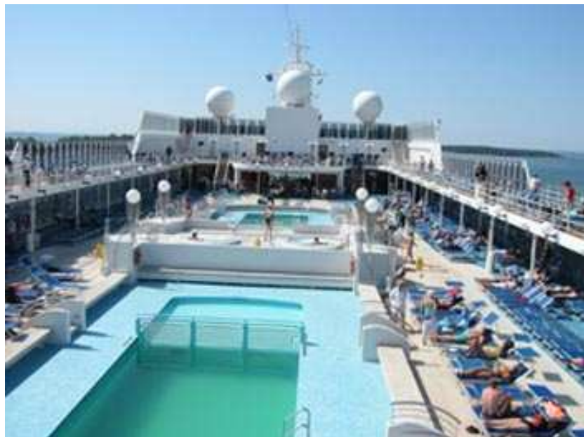
Crucero Lirica MSC

Una vez finalizada la excursión de esta ciudad regresamos a Copenhague y dimos por terminado el crucero por el Mar Báltico y de este crucero tenemos que destacar el increíble buen tiempo que disfrutamos diariamente durante todo el recorrido, donde no faltó cada día la preciosa puesta de sol correspondiente y el mar era una calma permanente.