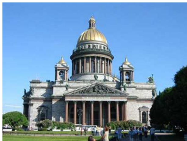
Catedral de San Isaac

Fundada por el zar Pedro el Grande el 16 de mayo de 1703 con la intención de convertirla en la nueva ventana de Rusia a