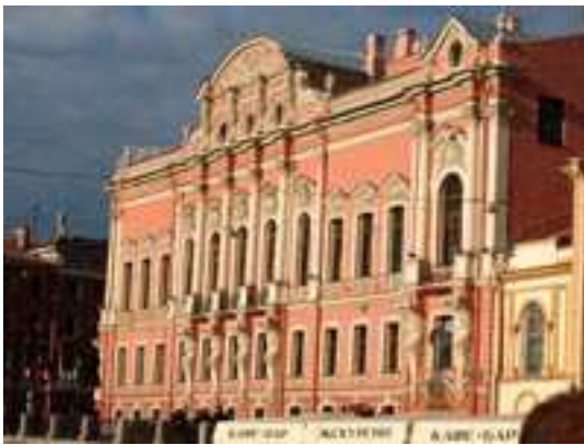
Palacio de los Biolosielski

Tras la guerra la ciudad sufrió la época de las purgas de los dirigentes soviéticos.