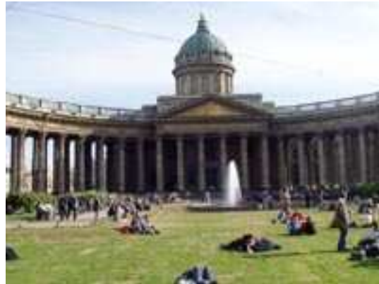
Catedral de Kazán

Dado que la construcción de la ciudad comenzó en tiempo de guerra, el primer edificio nuevo de la ciudad fue un fuerte militar que se llamaría Fortaleza de San Pedro y San Pablo y que se levanta aún sobre la isla de Zaiachiy en la rivera derecha del río Neva . Los diseñadores de la nueva fortaleza eran ingenieros alemanes invitados por el propio Zar, pero la mayor parte de la fuerza de obra la pusieron los siervos rusos. Así como las labores de drenaje de los alrededores del río y los palacios y otros edificios de piedra de las afueras que era la ciudad más artificial del mundo, diseñada para convertirse en la capital de Rusia . Podríamos hacer una comparación con Brasilia , diseñada para un propósito similar pero en otra época y en otro estilo. Otra ciudad con relativo paralelismo es Venecia en la cual se inspiró también el zar Pedro , que prohibió los puentes permanentes sobre el Neva para que se asemejase al Gran Canal y fomentó la construcción de canales en las calles siguiendo el patrón de Ámsterdam .