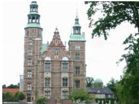
Castillo de Rosenborg

La principal atracción turística de Copenhague es el Tivoli , uno de los parques de atracciones más antiguos del mundo, otro parque de atracciones, el museo nacional, el zoológico , la residencia de la Familia Real , el teatro Real , la iglesia de Mármol , la nueva plaza del Rey, con una pista de patinaje sobre hielo en invierno, la estatua de la sirenita , la ciudad libre Christiania , un barrio hippie , la iglesia del salvador , desde cuya torre en espiral se puede admirar una magnífica vista sobre toda la ciudad, y las ruinas de la iglesia de San Nicolás, construida en 1.230.