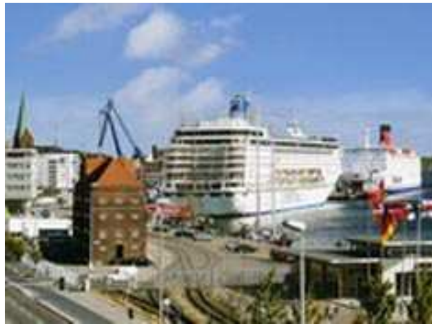
Puerto de Kiel

El Canal de Kiel, de 45 m de ancho y 14 m de profundidad, recorre 96 Km. desde Kiel a la desembocadura del río Elba .