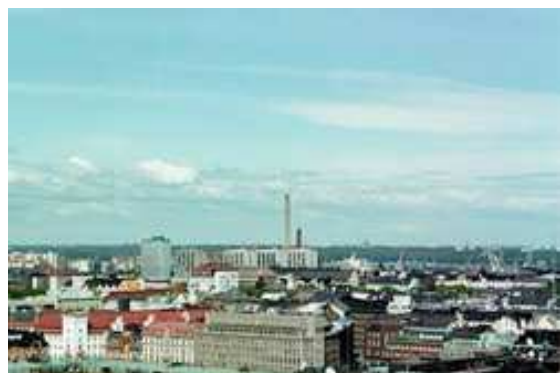
Panorámica de Helsinki

. La construcción de la fortaleza portuaria de (hoy en día conocida como la Fortaleza de Finlandia ) hizo crecer el status de la ciudad, pero no fue sino hasta que Rusia venció a