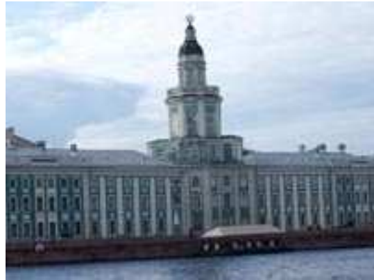
Museo de las Rarezas

Una vez finalizadas las visitas panorámicas de esta monumental ciudad y especialmente la Fortaleza de Pedro y Pablo, el Palacio de Invierno, el instituto Smolny, la Avenida Nevski, y el Museo Hermitage y el tiempo para las compras, regresamos al barco para iniciar el retorno con escala en Kiel