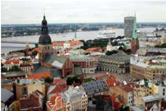
Vista de Riga

Riga es el principal nudo de transportes del país, en ella confluyen los transportes ferroviarios y el sistema de carreteras nacionales, la mayor parte de los turistas llega en avión al Aeropuerto Internacional de Riga el más grande de los países bálticos,