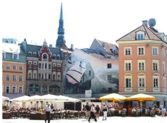
Rincón de cafeterías en Riga

Riga , la ciudad perteneció a los polacos y posteriormente a los suecos luego fue conquistada por los rusos tras una cruenta guerra. La importancia de Riga para el imperio ruso creció con el tiempo, hasta que la ciudad se convirtió en uno de los puertos más importantes de Rusia , la lengua oficial de la ciudad seguía siendo el alemán, si bien pronto sería remplazado por el ruso y con la disolución del imperio zarista, Riga se convierte en la capital de la nueva República independiente de Letonia , que luego fue anexada a la Unión soviética y ocupada por los alemanes durante la Segunda Guerra Mundial. La ciudad recupera su independencia con la caída de la URSS .